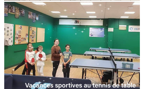
Vacances sportives au tennis de table