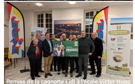
Remise de la cagnotte Lidl à l'école Victor Hugo