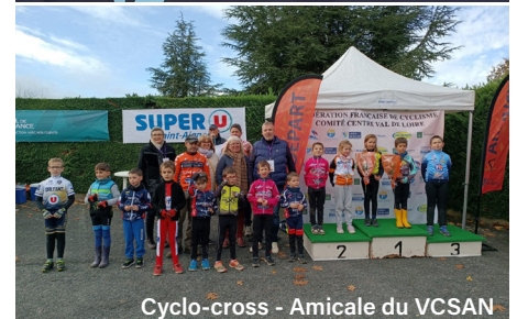
Cyclo-cross - Amicale du VCSAN