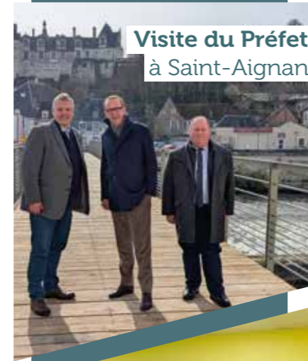
Visite du Préfet à Saint-Aignan