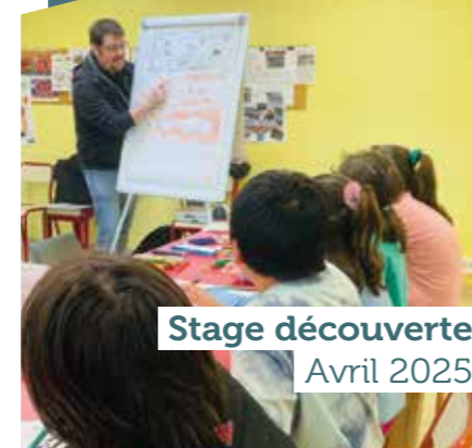
Stage découverte Avril 2025