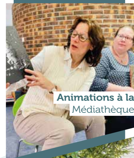
Animations à la Médiathèque