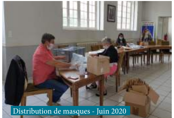
Distribution de masques - Juin 2020