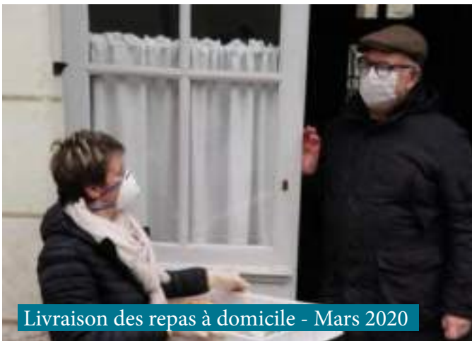
Livraison des repas à domicile - Mars 2020