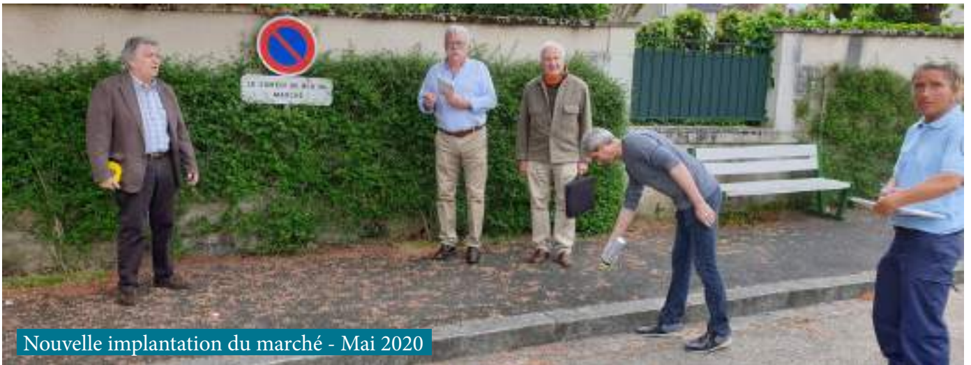
Nouvelle implantation du marché - Mai 2020