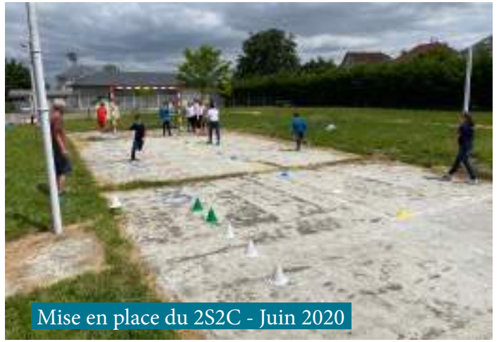
Mise en place du 2S2C - Juin 2020