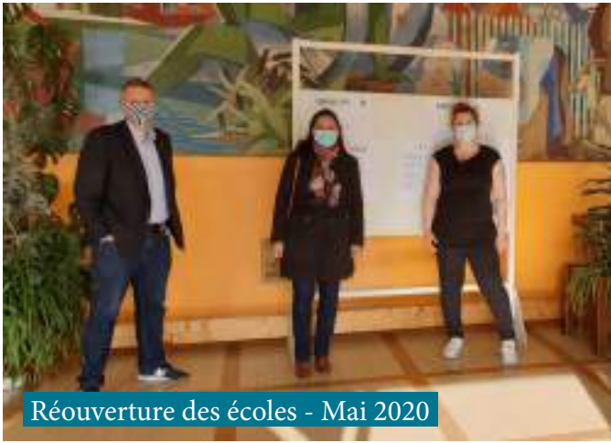
Réouverture des écoles - Mai 2020