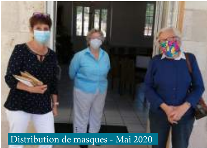
Distribution de masques - Mai 2020