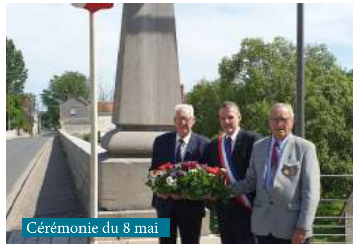
Cérémonie du 8 mai